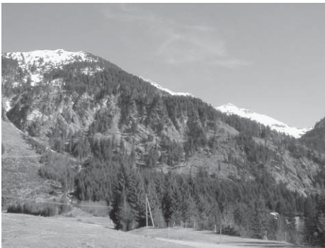
Abb1: Hang im Projektgebiet

Ein Schutzwald kann nicht nur als ökologisches System verstanden werden; vielmehr greifen in ihm auch sozio-politische und ökonomische Teilsysteme ineinander. Umso mehr können Probleme nicht nur einseitig durch biologisch-technische Maßnahmen behoben werden. Gefordert wird daher ein gesamtheitlicher Ansatz, der den politisch-gesellschaftlichen Aspekt berücksichtigt. Umweltmediationsverfahren analysieren die Konfliktfelder und Interessen