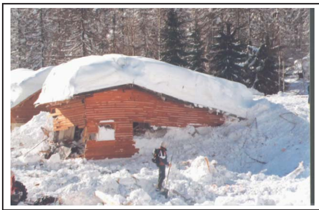
L'un des chalets détruits par l'avalanche de Montroc le 9 février 1999 One of the chalets destroyed at Montroc on February 9 th , 1999