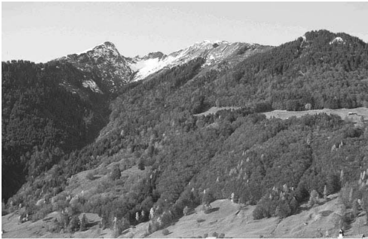
Fig.1: Natural based protection forest in the Tamina valley SG, Switzerland

Abb.1: Naturnaher Schutzwald im Taminatal SG, Schweiz