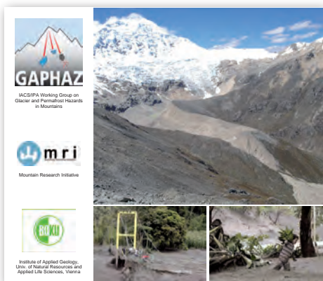
Einladungsfolder für den Glacier Hazard Workshop in Wien.

Die INTERPRAEVENT unterstützte die Produktion von Seminarunterlagen für den International Workshop on Glacier Hazards, Permafrost Hazards and GLOFs in Mountain Areas: Processes, Assessment, Prevention, Mitigation, welcher vom 10. zum 13. November 2009 in Wien abgehalten wurde. Für die INTERPRAEVENT war das eine gute Möglichkeit international im Bereich der Naturgefahrenprävention aufzutreten und auf ihre Aktivitäten aufmerksam zu machen.