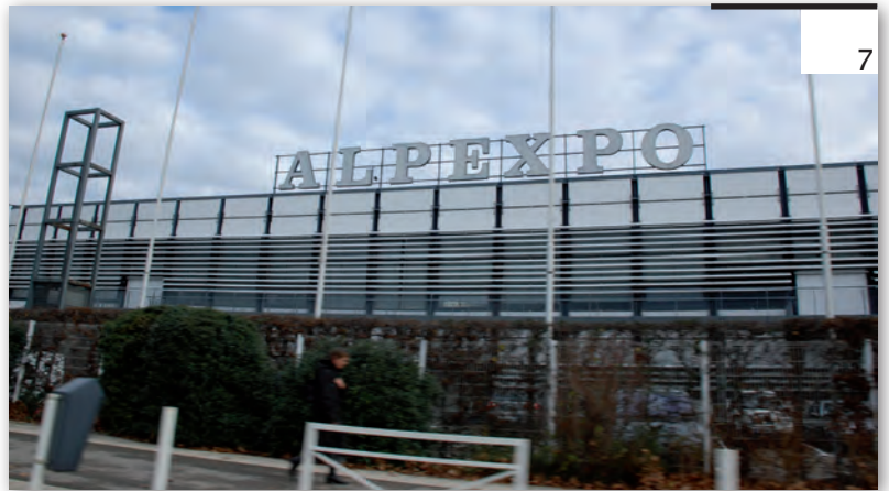
Das ALPEXPO Messecenter in Grenoble, wo der INTERPRAEVENT Kongress 2012 abgehalten werden soll.

Unter der Herausgeberschaft der Internationalen Forschungsgesellschaft INTERPRAEVENT ist es mit Unterstützung des Lebensministeriums erstmalig gelungen, gemeinsam mit der Wildbach- und